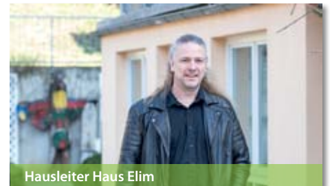
Hausleiter Haus Elim